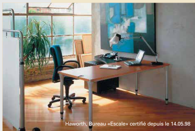
Haworth, Bureau «Escale» certifié depuis le 14.05.98

“Le personnel est plus productif, donc plus efficace, souligne le directeur d'une PME de 200 personnes dans le secteur tertiaire”